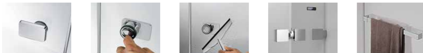
"Limpieza interior sin obstáculos".