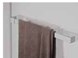
OPCIONAL: TOALLERO / ESTANTE ver página 275