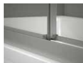
Con guía inferior