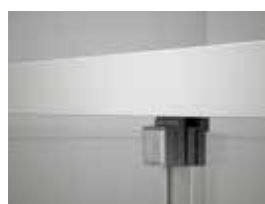
Juntas verticales de estanqueidad

Ausencia de perfilera entre puertas que aporta minimalismo.