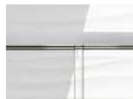
Juntas verticales de estanqueidad