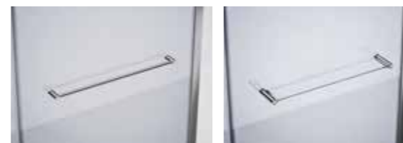
OPCIONAL: TOALLERO / ESTANTE ver página 275